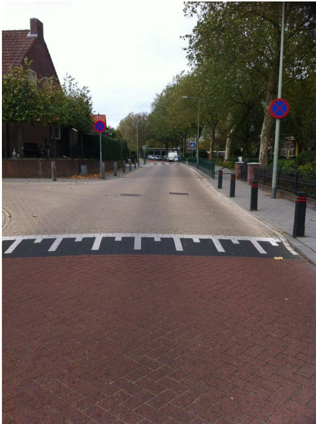
Aanzicht vanaf Prinses Margrietstraat.