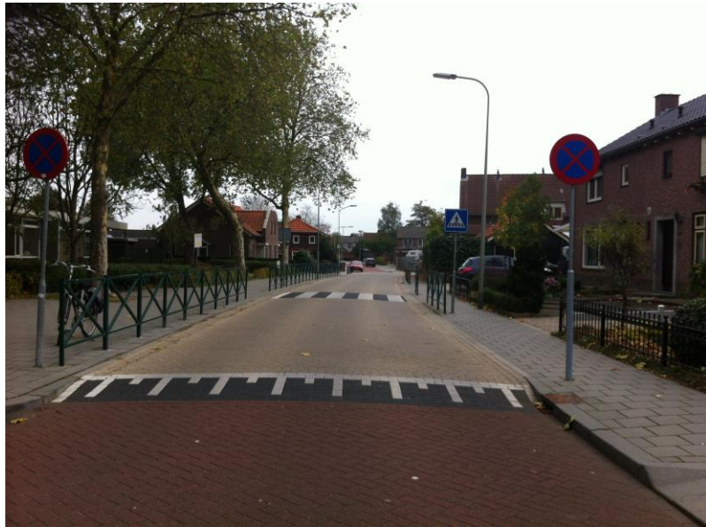
Aanzicht vanaf Pica Mare.

Dit bord staat bij onze school.( Zie foto's)